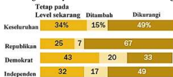
Grafik 1.4 Pandangan Masyarakat AS Terkait Jumlah Imigrasi Ke AS.

Dari grafik diatas dapat diketahui bahwa pandangan masyarakat AS terbagi dalam melihat isu kedatangan imigran, mayoritas dari masyarakat yang berafiliasi dengan partai Demokrat mengatakan bahwa imigran memberikan manfaat yang baik bagi AS, namun masyarakat yang berafiliasi dengan partai Republikan mengatakan sebaliknya, yaitu imigran memberikan dampak buruk bagi AS.